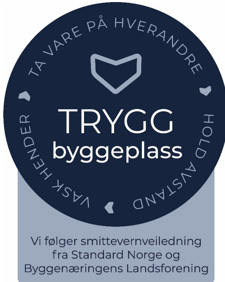
Figur 2 – Trygg byggeplass

Virksomheter som forplikter seg til å følge reglene og gjennomføre tiltakene i dette dokumentet, kan benytte emblemet vist på Figur 2.