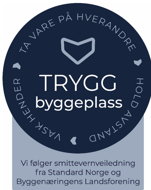
Figur 2 — Trygg byggeplass

Virksomheter som forplikter seg til å følge reglene og gjennomføre tiltakene i dette dokumentet, kan benytte emblemet vist på figur 2.