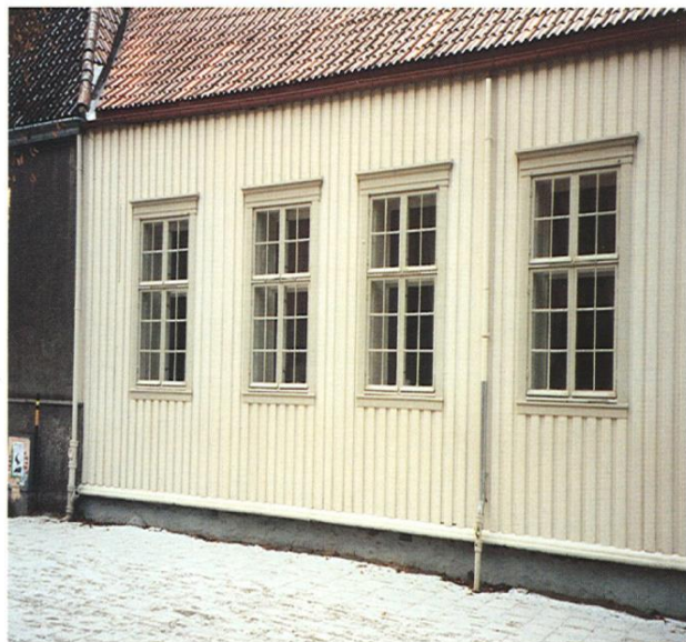
TREHUS 1: 0%