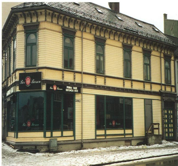
TREHUS 3: 100%