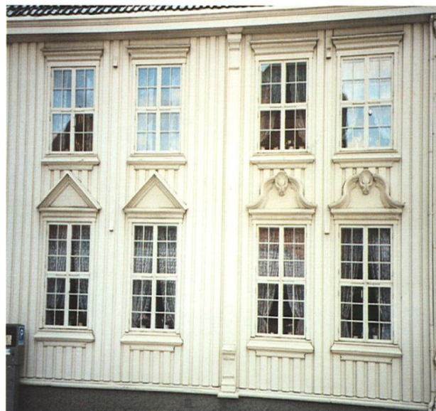
TREHUS 2: 50%