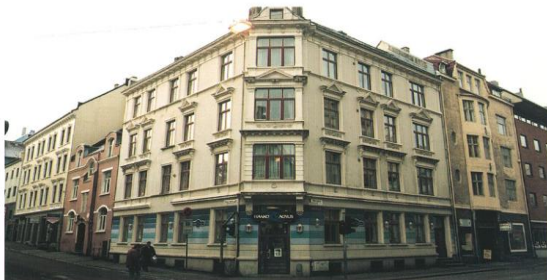
FASADE 10 – anbefalt prosentsats 300%