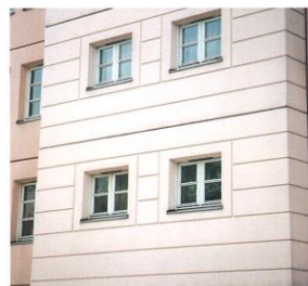
FASADE 2 – anbefalt presentsats 25%