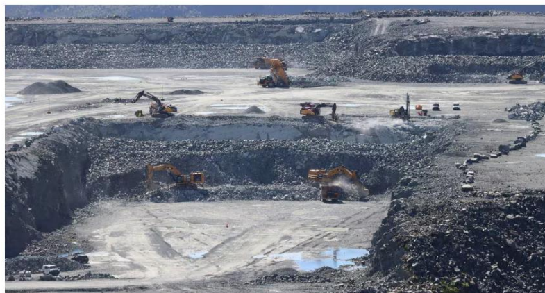
BREMANGER QUARRY: Steinen herfrå blir eksportert til Nederland.

Stein frå eit av Noregs største steinbrot kan gjere folk sjuke. Det fryktar styresmaktene i Nederland.